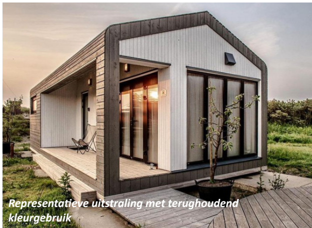
Representatieve uitstraling met terughoudend kleurgebruik

De referentiebeelden zijn slechts ter inspiratie en kunnen afwijken van de in dit kavelpaspoort opgenomen randvoorwaarden. Raadpleeg het beeldkwaliteitplan voor concrete esthetische eisen.