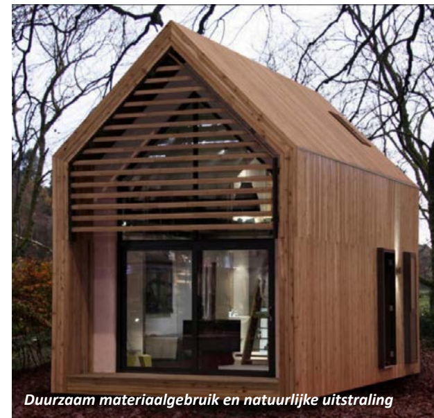
Duurzaam materiaalgebruik en natuurlijke uitstraling