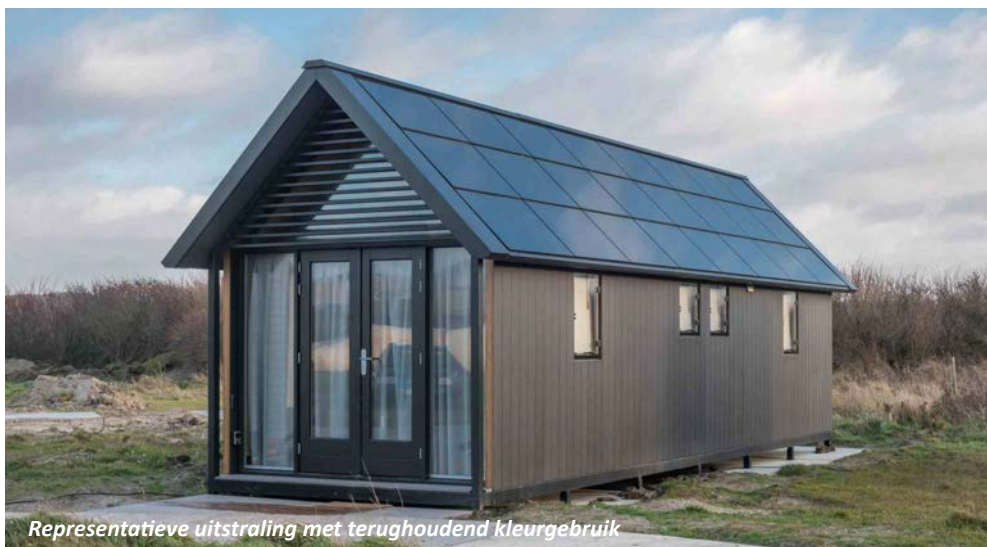
Representatieve uitstraling met terughoudend kleurgebruik