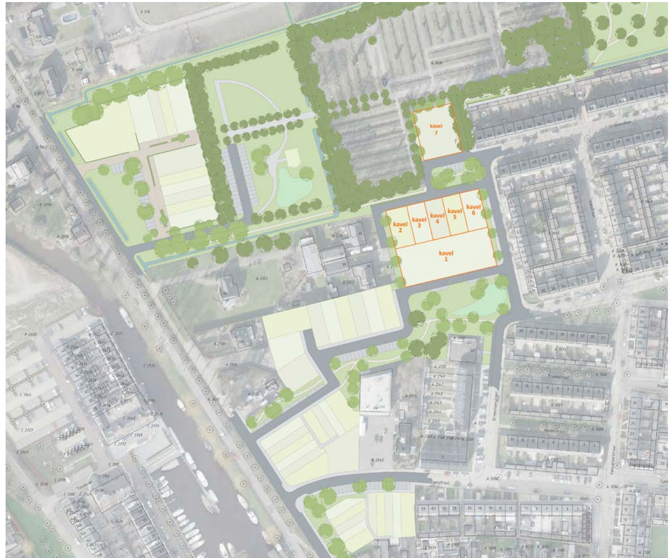
Locatie zelfbouw kavels in plan Havendijk Kom Noord

Met deze nieuwe ontwikkeling krijgt u nu de kans om uw eigen thuis te realiseren. Dit kavelpaspoort beschrijft een samenvatting van de randvoorwaarden voor bouwkavel 7.