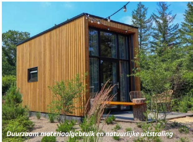
Duurzaam materiaalgebruik en natuurlijke uitstraling