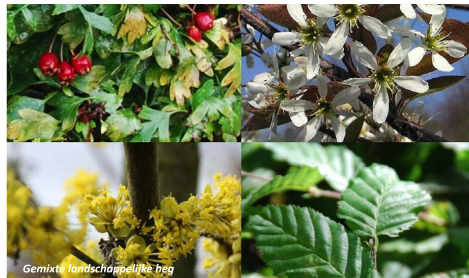
Gemixte landschappelijke heg